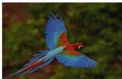
对比度差，色彩表现差