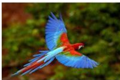
对比度高，色彩表现好