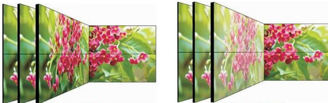
JUFENG LED WALL

液晶拼接单元，具有超宽可视角度，最大可视角度可达(V)178°(H)178°，可以从不同的角度得到更好的图像质量和颜色均匀性。